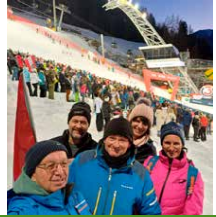
Fan-Support für die Österreicher vom abz Lambach in Schladming