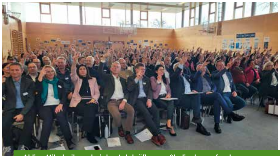
Aktive Mitarbeit war bei den Lehrkräften am Studientag gefragt.